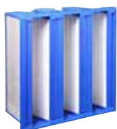
Foto: Kompaktiltre F9

Anvendes SPC-enheden til for-separering af trevler uden risiko for gnistdannelse/varmeudvikling, tømmes nylon-forfangfilteret blot, når det er ved at være fuldt. Er der risiko for varmeudvikling, bør man for at nedsætte brandrisikoen tage nylon-trådfanget ud efter endt brug, når SPC-enheden ikke er i brug gennem længere tid, f.eks. natten over.